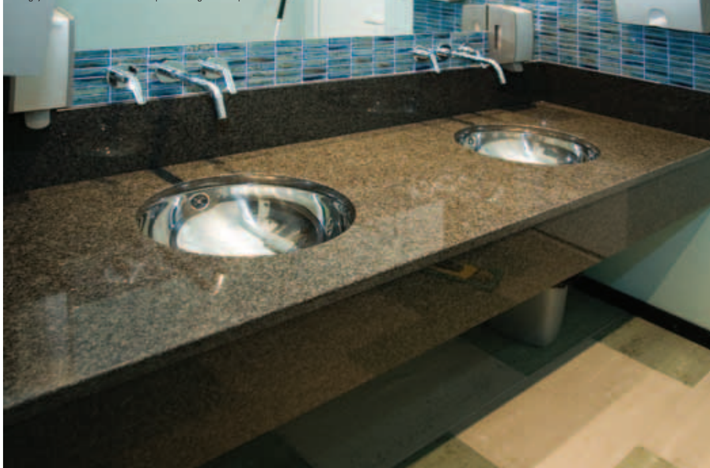
Köögi ja vannitoa valamud alune tööpind salongist Kivisepad.

Tööpinnaks tasuks siiski osta kõige kvaliteetsem materjal, mida on võimalik endale lubada. See annab palju juurde köögi väljanägemisele ja mis veel olulisem – tööpind peab vastu pidama suurele kasutamisele. Kombinatsioon – välimus ja vastupidavus – teeb sageli kõige valitumaks tööpinnamaterjaliks nii naturaalse kivi kui ka tehiskivid ehk siis uued materjalid.