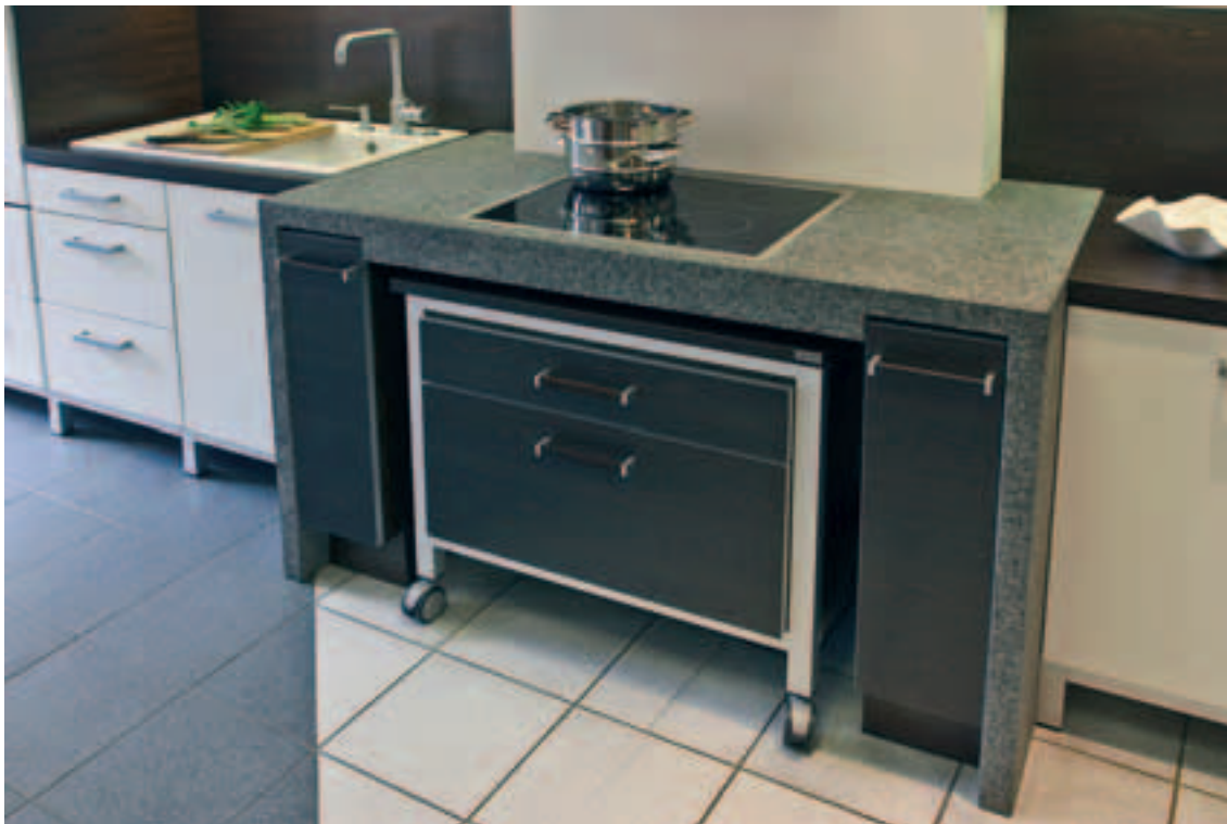
Revalstone graniidist tööpind