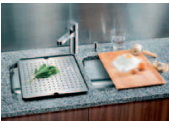
Compac tööpind salongist Hansakivi. Roostevabast terasest valamu ja segisti tööpinna ühe osana, salongist Eero.

Köögi tööpinna võiks valida sellise, mis sobib kõige paremini teie elustiiliga. Esimene küsimus - kui palju te kööki kasutate?