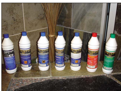
Hooldus- ja kaitsevahendid

Katuseplaatide paigaldamisel kasutatakse happekindlaid naelu või kruvisid.